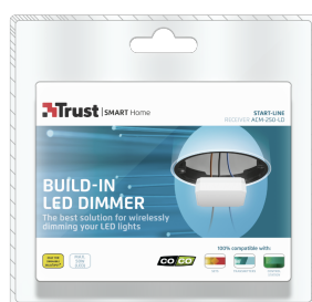
PACKAGE FRONT 1