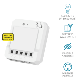
PRODUCT ESHOT 1