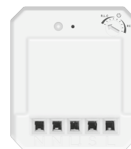
PRODUCT TOP 1