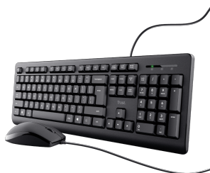
PRODUCT VISUAL 1