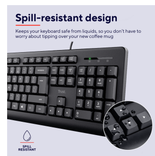
PRODUCT PICTORIAL 3