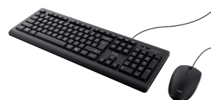
PRODUCT VISUAL 2