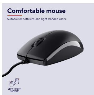
PRODUCT PICTORIAL 4