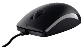
PRODUCT VISUAL 3