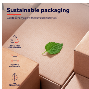
PRODUCT PICTORIAL 5