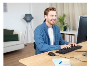
LIFESTYLE VISUAL 1