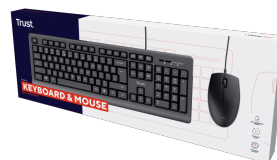
PACKAGE VISUAL 1