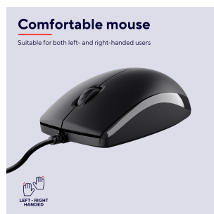
PRODUCT PICTORIAL 4