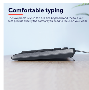
PRODUCT PICTORIAL 2