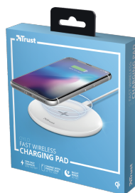
PACKAGE VISUAL 1