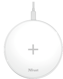
PRODUCT TOP 1