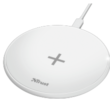
PRODUCT VISUAL 2