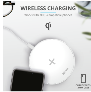
PRODUCT PICTORIAL 1