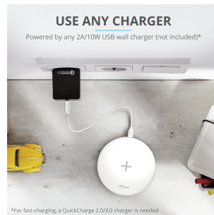
PRODUCT PICTORIAL 4