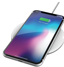
PRODUCT VISUAL 3