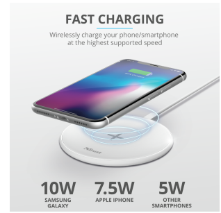
PRODUCT PICTORIAL 2