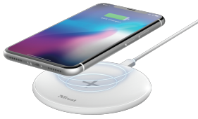
PRODUCT VISUAL 1