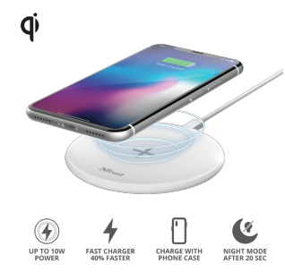
PRODUCT ESHOT 1