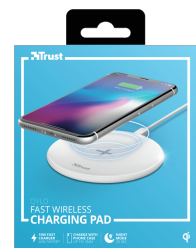
PACKAGE FRONT 1