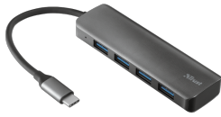
PRODUCT VISUAL 1