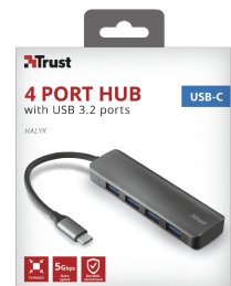
PACKAGE FRONT 1