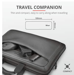
PRODUCT PICTORIAL 4