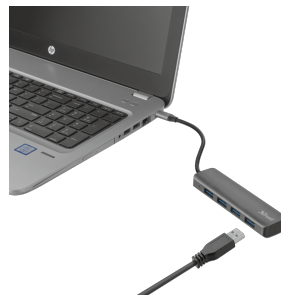
PRODUCT VISUAL 3