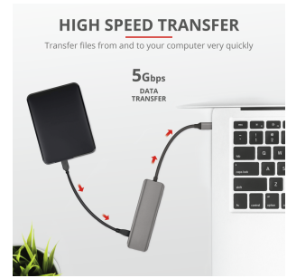
PRODUCT PICTORIAL 2