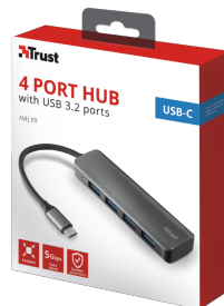
PACKAGE VISUAL 1