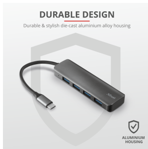
PRODUCT PICTORIAL 3