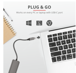
PRODUCT PICTORIAL 5