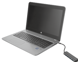
PRODUCT VISUAL 2