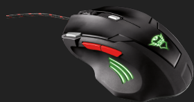
PRODUCT BACK 2