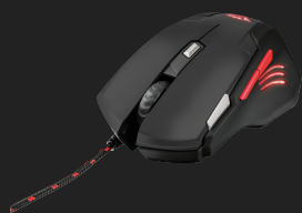
PRODUCT VISUAL 1