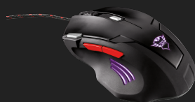
PRODUCT BACK 4