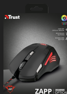
PACKAGE FRONT 1