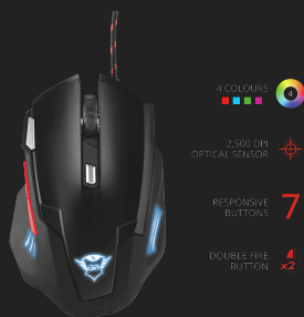
PRODUCT ESHOT 1