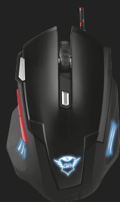
PRODUCT TOP 1