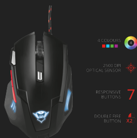
PRODUCT ESHOT 2