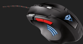
PRODUCT BACK 3