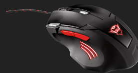
PRODUCT BACK 1