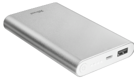
PRODUCT VISUAL 1