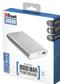
PACKAGE VISUAL 1