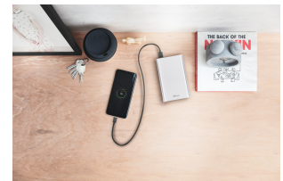
LIFESTYLE VISUAL 1