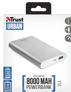
PACKAGE FRONT 1