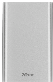
PRODUCT FRONT 1