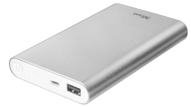
PRODUCT VISUAL 2