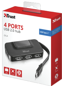
PACKAGE VISUAL 1