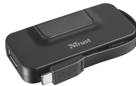
PRODUCT VISUAL 2