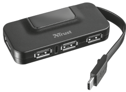
PRODUCT VISUAL 1