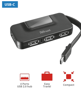
PRODUCT ESHOT 1