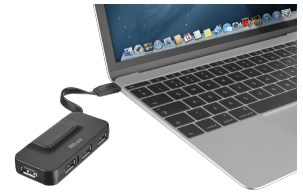
PRODUCT VISUAL 3