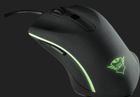
PRODUCT VISUAL 3