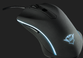
PRODUCT VISUAL 2