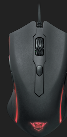
PRODUCT TOP 1