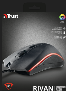
PACKAGE FRONT 1