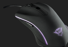
PRODUCT VISUAL 4