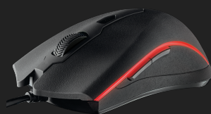
PRODUCT VISUAL 5