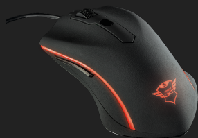
PRODUCT VISUAL 1