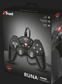
PACKAGE VISUAL 1