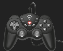
PRODUCT TOP 1