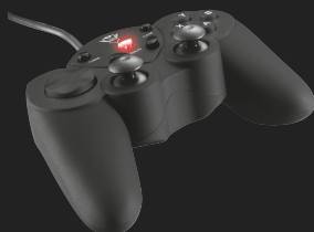
PRODUCT VISUAL 2