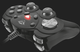
PRODUCT VISUAL 1