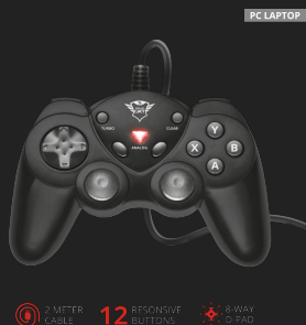
PRODUCT ESHOT 1