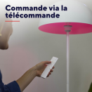
71400_FR_pictures_product_pictorial_2.jpg ImageWidth: 4.000 px ImageHeight: 4.000 px ImageResolution: 300 dpi