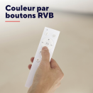
71400_FR_pictures_product_pictorial_3.jpg ImageWidth: 4.000 px ImageHeight: 4.000 px ImageResolution: 300 dpi