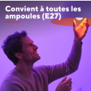
71400_FR_pictures_product_pictorial_4.jpg ImageWidth: 4.000 px ImageHeight: 4.000 px ImageResolution: 300 dpi