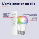
71400_FR_pictures_product_pictorial_7.tif ImageWidth: 4.000 px ImageHeight: 4.000 px ImageResolution: 300 dpi