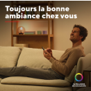
71400_FR_pictures_product_pictorial_5.jpg ImageWidth: 4.000 px ImageHeight: 4.000 px ImageResolution: 300 dpi